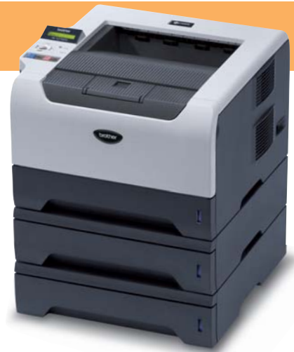
HL-5280DW inklusive zwei optionaler Papierkassetten

Bei Teamdruckern spielt neben der Performance auch das Papier-Management eine wesentliche Rolle. Der HL-5280DW verfügt über eine 250 Blatt Papierkassette sowie eine 50-Blatt-Multifunktionszufuhr. Sollten 300 Blatt Papierkapazität nicht ausreichen, kann der Drucker um bis zu zwei weitere Kassetten für jeweils 250 Blatt optional aufgerüstet werden. Insgesamt 800 Blatt bieten nicht nur reichlich Vorrat, sondern machen auch flexibel bei der Papierwahl. Die Zuführungen können gezielt angesteuert werden, sodass verschiedene Papiertypen und -größen gleichzeitig benutzt werden können.